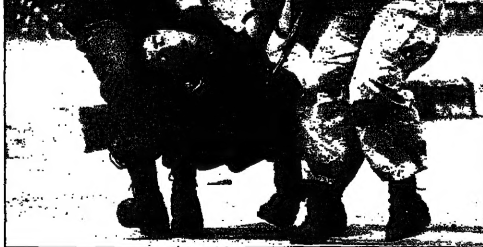
قوات شرطة فلسطينية تنقل جرحيا عليه على نتيجة إطلاق قوات اسرائيلية قذائف مسيلة للمموج في ضواحي بيت لحم

القسم - من شارلي فيضان وهاوارد غولد: وضع رئيس الوزراء الاسرائيلي بنيامين نتنياهو امس الخميس المواقف الدفاعية في موقف محرج ووضع الفلسطينيين في موقف دفاعي. ووجه حرق للاحتجاج الذي نظمته منظمة حقوق الانسان في تل ابيب.